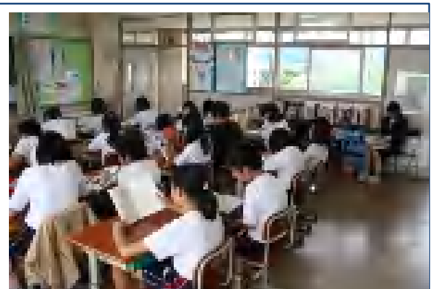
昼の清掃終了後、学級がシーンとした雰囲気です。読書が行われています。(於:5の1教室 H24.6.5)

この繰り返しのサイクルの中に児童の成長があると考えます。読書を通して、児童達がさらに成長できますよう学校、そしてご家庭で、この環境を創り出していきたいものです。